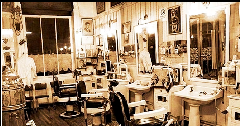
Peluquería Francesa Lavaud.