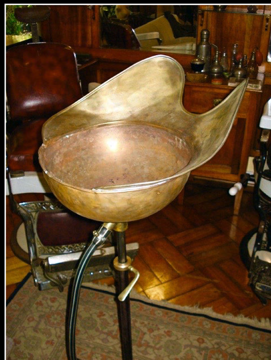
Antiguo lavatorio para cabello

Extraño y bello “vaporizador” de bronce (c. 1920), que complementa el excelente conjunto de la peluquería: se trata de un calentador de toallas para afeitar que, además, servía para cauterizar las láminas de las navajas, y que funcionaba con brasas de carbón.