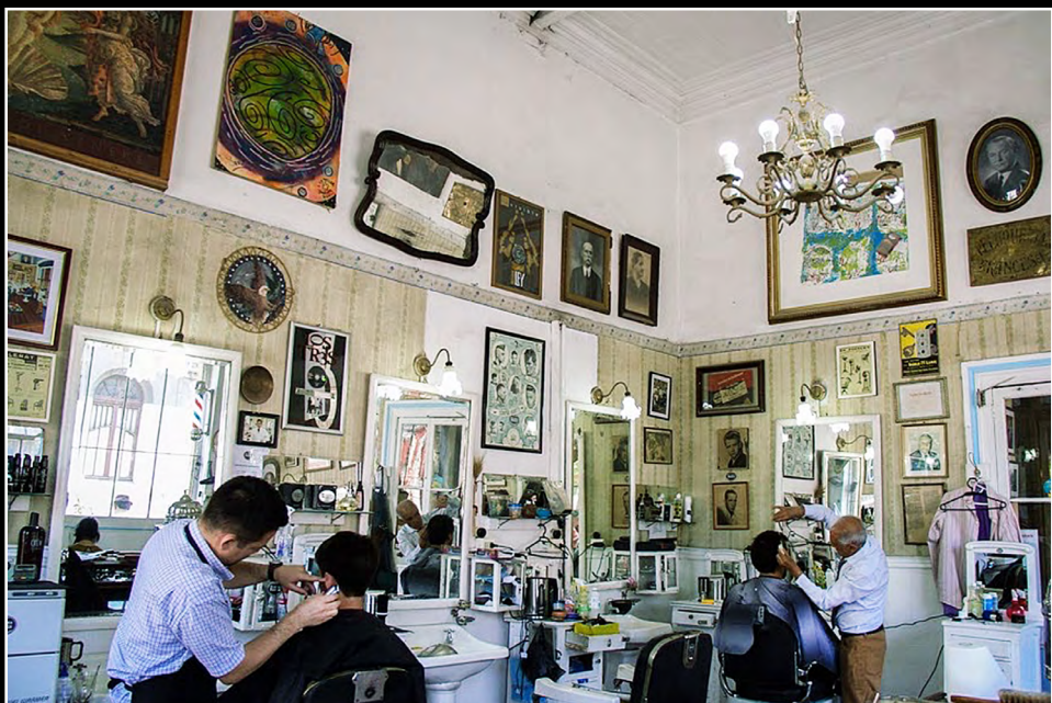
Peluquería Francesa Lavaud.

Pocas son las peluquerías chilenas antiguas que han logrado salvarse del vertiginoso y voraz paso del tiempo, muchos son los factores que las han hecho desaparecer, especialmente la construcción masiva de grandes centros comerciales y la cada vez más intensa competencia.