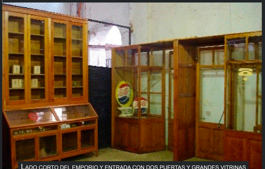
LADO CORTO DEL EMPORIO Y ENTRADA CON DOS PUERTAS Y GRANDES VITRINAS