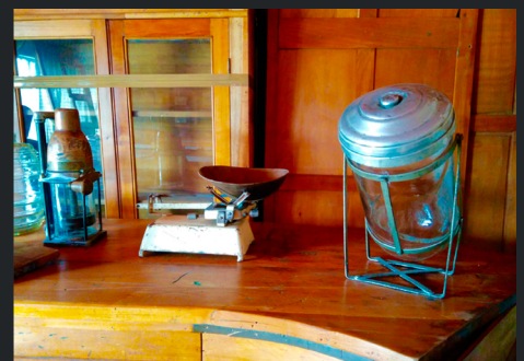
MÁQUINA ACEITERA, BALANZA Y FRASCO GOLOSINAS