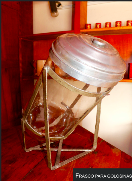
FRASCO PARA GOLOSINAS