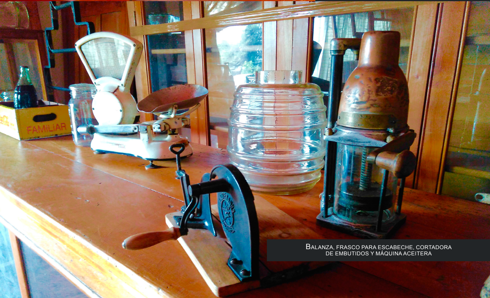
BALANZA, FRASCO PARA ESCABECHE, CORTADORA DE EMBUTIDOS Y MÁQUINA ACEITERA