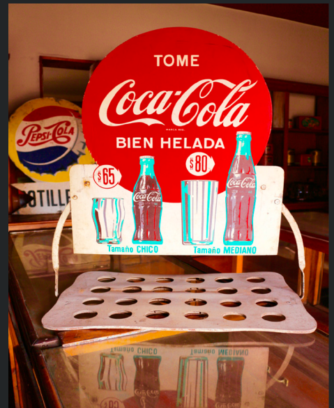
PUBLICIDAD Y SOSTENEDOR DE BOTELLAS DE COCA-COLA