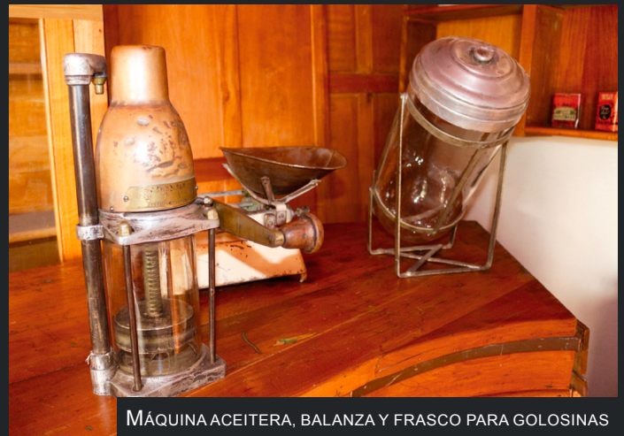
MÁQUINA ACEITERA, BALANZA Y FRASCO PARA GOLOSINAS