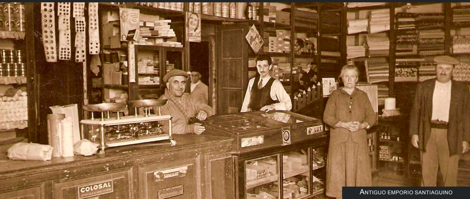
ANTIGUO EMPORIO SANTIAGUINO