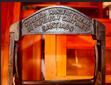
PORTA PAPEL DE LA COMPAÑIA MANUFACTURERA DE PAPELES Y CARTONES - SANTIAGO