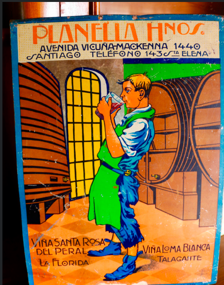
PUBLICIDAD METÁLICA DE VINO "PLANELLA HNOS."