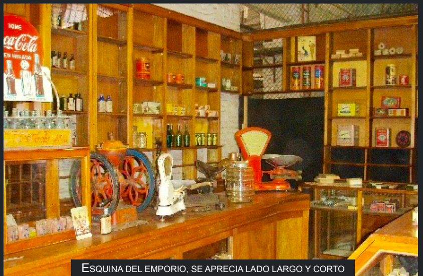
ESQUINA DEL EMPORIO, SE APRECIA LADO LARGO Y CORTO

El conjunto se vende con todos los artefactos y productos que lograron ser rescatados en su bodega, tales como: balanzas, frasco de vinagre, cortador de cecinas, porta papel, publicidades antiguas, envases de galletas, picles, mermeladas, café, leche, etc.