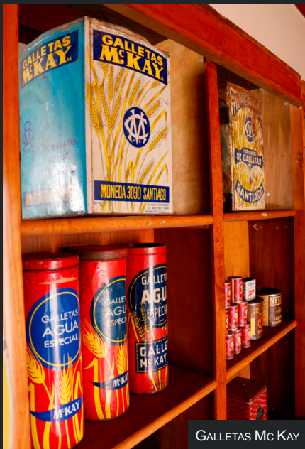
GALLETAS Mc Kay