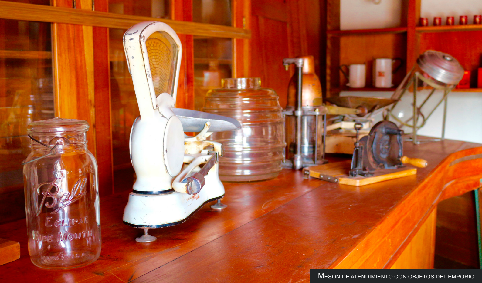
MESÓN DE ATENDIMIENTO CON OBJETOS DEL EMPORIO