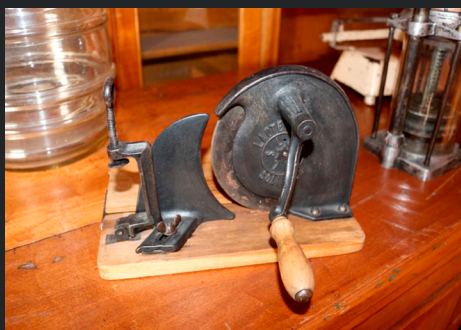
MÁQUINA PARA CORTAR EMBUTIDOS