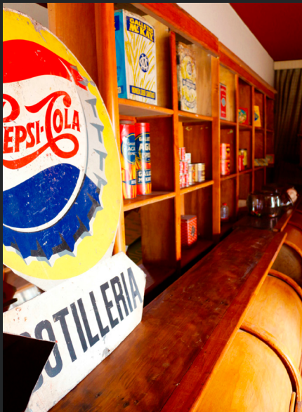
BASE ESTANTE LARGO (COM PUERTAS PRODUCTOS A GRANEL) Y PUBLICIDAD DE PEPSI-COLA