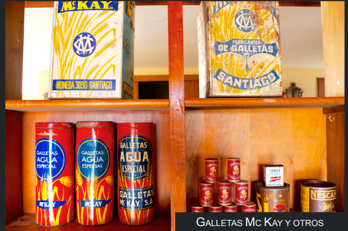
GALLETAS Mc Kay Y OTROS