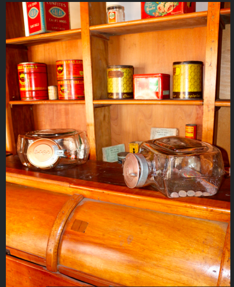
DOS FRASCOS DE VIDRIO PARA GOLOSINAS