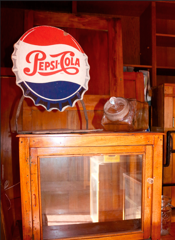
PEQUEÑA VITRINA PARA GUARDAR QUESO (CON PUBLICIDAD DE PEPSI-COLA)