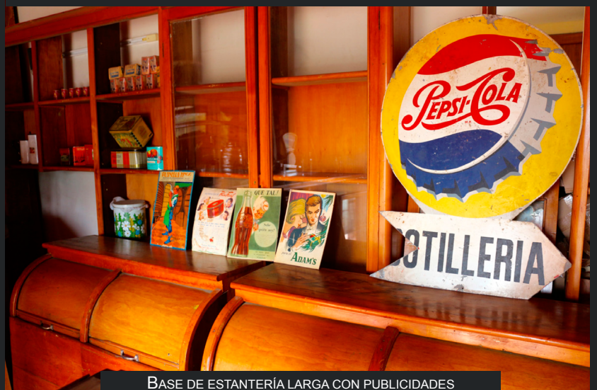
BASE DE ESTANTERÍA LARGA CON PUBLICIDADES